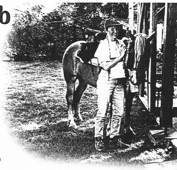
Aufbruch zum „Abenteuer Deutschland vom Sattel aus“

Moonfire Lady, meine 5 1/2-jährige Haflingerstute von Stuart (Steiger), mit etwas Araberblut von der Mutter Mali, Züchter: Horst Hechler, Lindenfels, marschierte munter dahin. Kurze Zeit später kamen wir an einer schlafenden Schafherde vorbei, die natürlich just in dem Moment erwachte, als wir direkt daneben waren. Lady machte einen kleinen Satz auf der Stelle, der nicht weiter tragisch gewesen wäre, hätte ich nur allein im Sattel gesessen. So fing durch das Mehrgewicht an Gepäck die ganze Chose das Rutschen an. Man sollte zu Hause wenigstens einen Proberitt mit vollem Gepäck machen. Ja, ja die Faulheit. Also anhalten, neugurten und das Gepäck fest verzurren, dann weiter. Ich hatte mir schönes Wetter gewünscht. Doch wie heiß es so schön, sei vorsichtig mit deinen Wünschen, sie könnten in Erfüllung gehen. Ruckzuck kletterten die Temperaturen auf 25 °, und die Luftfeuchtigkeit war hoch. Die Bremsen freuten sich über das unverhoffte Festmahl und luden auch ihre Kumpanen ein. Also absitzen, Pony einsprühen, eine Stunde Ruhe vor den Biestern. Als ich auf der Karte den zurückgelegten mit dem restlichen Weg zum Zielort verglich, dachte ich, das schaffen wir nie.